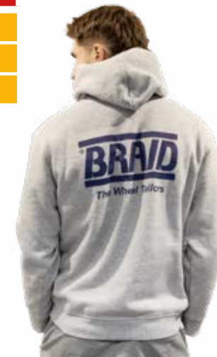
Light grey hoodie / Sudadera gris claro