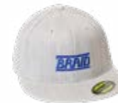
Light grey cap / Gorra gris claro