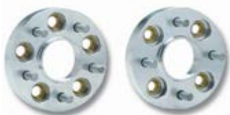
DOUBLE CENTERING AND DOUBLE FIXING SPACERS