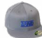
Dark grey cap / Gorra gris oscuro