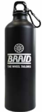
Water bottle / Botella de agua