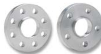
DOUBLE CENTERING SPACERS

Unit price. Bolting included. For other thickness ask for prices. / Precio unitario. Tornillería incluida. Consultar precio para otros groesos.