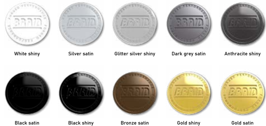
White shiny Silver satin Glitter silver shiny Dark grey satin Anthracite shiny Black satin Black shiny Bronze satin Gold shiny Gold satin

The colours displayed are for reference only and may vary due to screen calibration differences. Los colores son orientativos y pueden variar según la calibración de la pantalla.