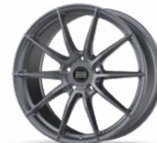
BPC 02 FF