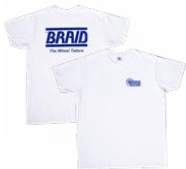
White t-shirt / Camiseta blanca