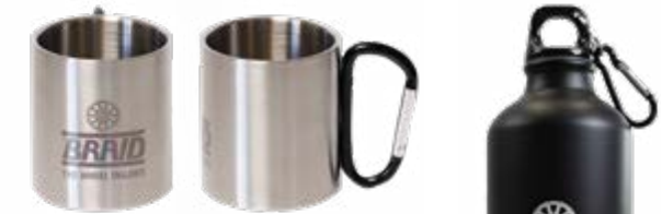
Metallic mug / Taza metálica