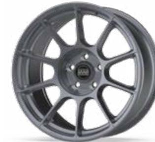
BPR 01 FF (CONCAVE)