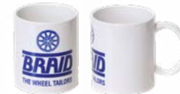
Ceramic mug / Taza de cerámica