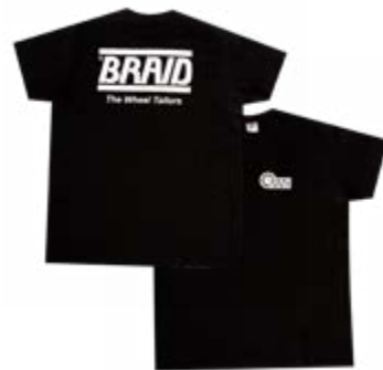
Black t-shirt / Camiseta negra