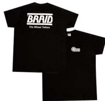
Black t-shirt / Camiseta negra