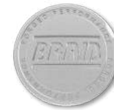
Glitter silver shiny