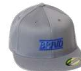
Dark grey cap / Gorra gris oscuro