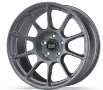
new BPR 01 FF (CONCAVE)