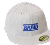
Light grey cap / Gorra gris claro