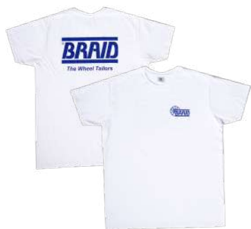
White t-shirt / Camiseta blanca