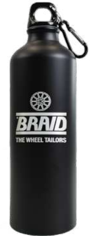
Water bottle / Botella de agua