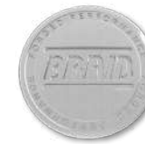
Glitter silver shiny