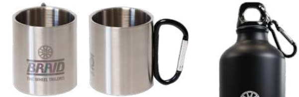
Metallic mug / Taza metálica