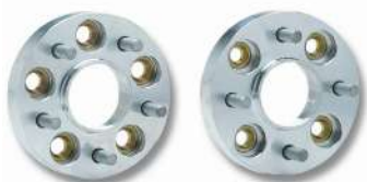
DOUBLE CENTERING AND DOUBLE FIXING SPACERS