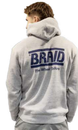
Light grey hoodie / Sudadera gris claro