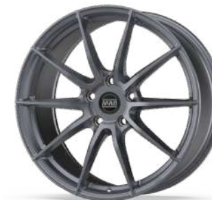
new BPC 02 FF