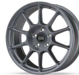
new BPR 01 FF (FLAT)

Llantas fabricadas a medida según requerimientos del cliente. Casquillos de acero en los asientos de los tornillos/tuercas. Centraje directo de llanta (no requiere arillo de plástico).