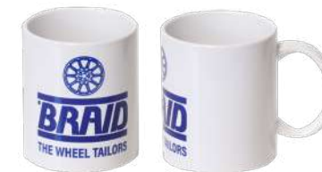
Ceramic mug / Taza de cerámica