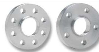
DOUBLE CENTERING SPACERS

Unit price. Bolting included. For other thickness ask for prices. / Precio unitario. Tornillería incluida. Consultar precio para otros groesos.